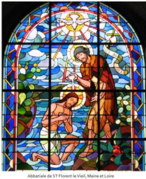
Abbatiale de ST Florent le Vieil, Maine et Loire