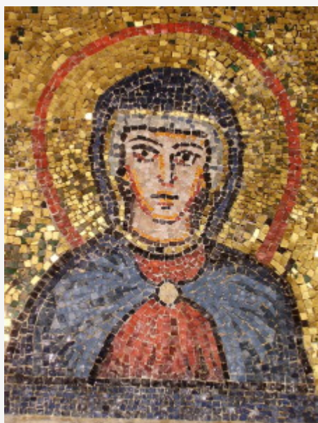
Marie, église Ste Praxède, Rome.

de la Bonne Nouvelle... Et quelle est-elle ? Evoquons-là avec cette phrase de Paul Claudel : « Dieu n'est pas venu supprimer la souffrance ; il est venu la remplir de sa Présence », une Présence qui est Joie, Paix, Bonheur Profond, un Bonheur que nul « méchant » ne peut atteindre... « Heureux les affligés, ils seront consolés... Heureux êtes-vous quand on vous insultera, qu'on vous persécutera, et qu'on dira faussement contre vous toute sorte d'infamie à cause de moi. Soyez dans la joie et l'allégresse » (Mt 5,5.11-12).