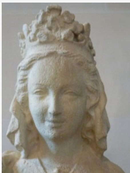
Marie, Musée de Sens

(17) Alors, furieux contre la Femme, le Dragon s'en alla guerroyer contre le reste de ses enfants, ceux qui gardent les commandements de Dieu et possèdent le témoignage de Jésus. »