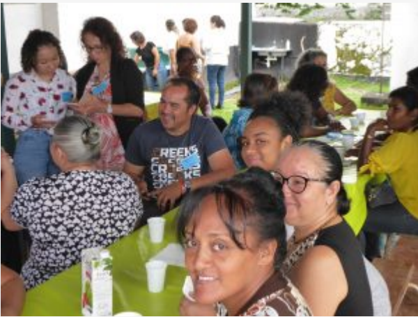
L'autre côté de la salle paroissiale et après la prière du matin, les Laudes, le petit déjeuner