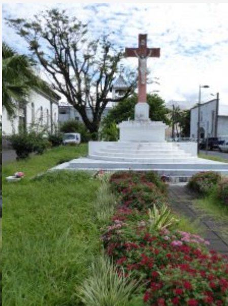
Eglise de St Benoît et Calvaire à droite de l'Eglise