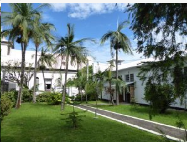
Eglise et sur la droite, la salle paroissiale