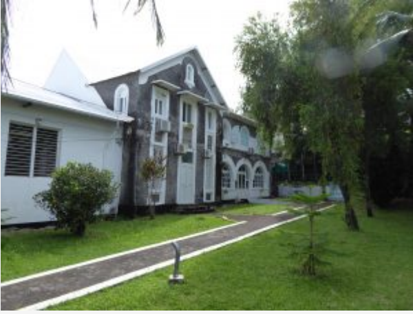
Cure de St Benoît