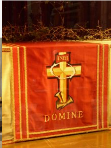
Coffre où est conservé le Saint Suaire dans la cathédrale St Jean Baptiste à Turin