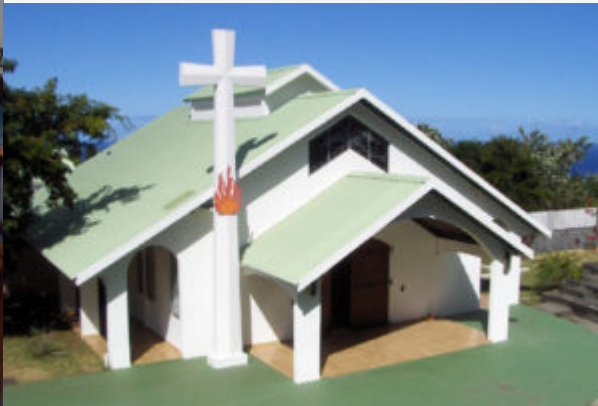
Carmel des Aviron - Ile de la Réunion